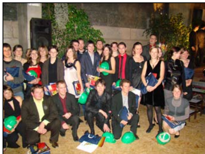
Les diplômés 2009 de l'option paysage MOI (Maîtrise d'oeuvre et Ingénierie)