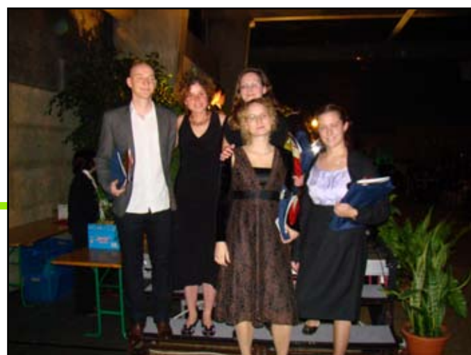
Les diplômés 2009 ayant suivi une autre spécialisation