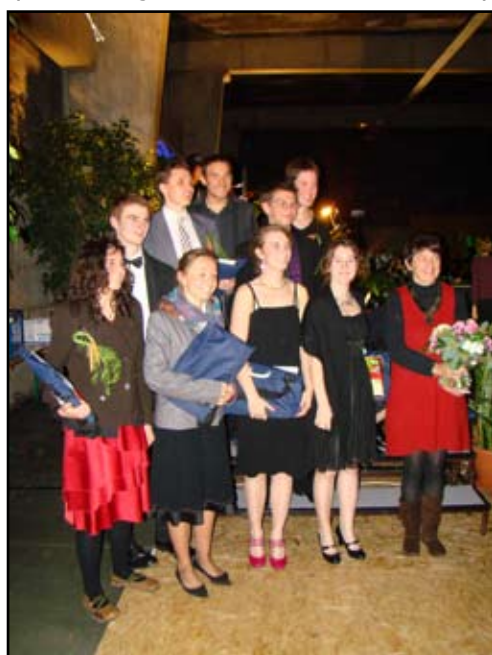
Les diplômés 2009 de l'option FLAM (Fruits & Légumes - Alimentation - Marchés)