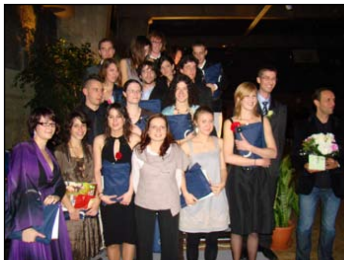
Les diplômés 2009 de l'option paysage IT (Ingénierie des territoires)