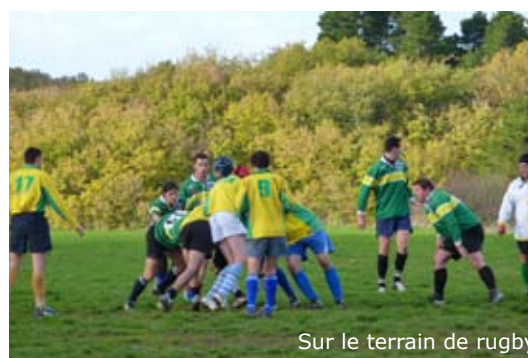
Sur le terrain de rugby