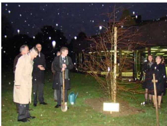
Arrivée du Nyssa sylvatica dans l'arboretum... qui n'a pas manqué d'eau à la plantation !