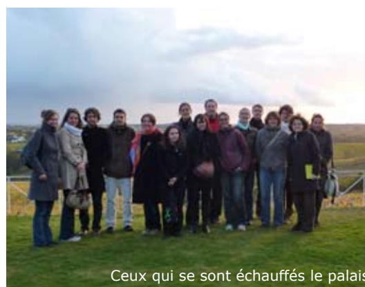
Ceux qui se sont échauffés le palais

Rendez-vous à l'automne pour les prochaines Rencontres Sportives de l'AIHP, en espérant une participation un peu plus importante des étudiants.