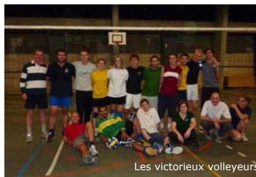
Les victorieux volleyeurs