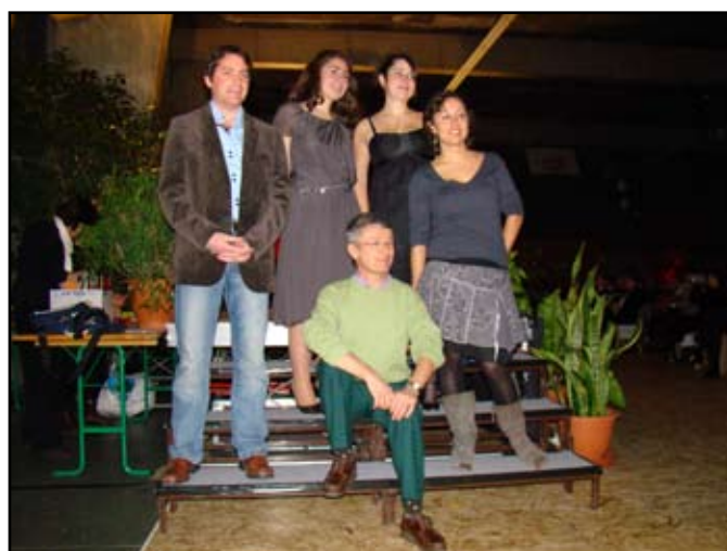
Les diplômés 2009 de l'option SEVE (Santé du végétal et Environnement)