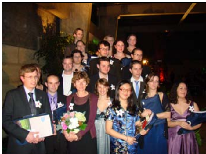
Les diplômés 2009 de l'option HORVAL (Horticulture Ornementale et Valorisation)