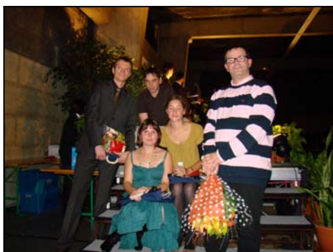
Les diplômés 2009 de l'option APS (Amélioration des plantes et semences)