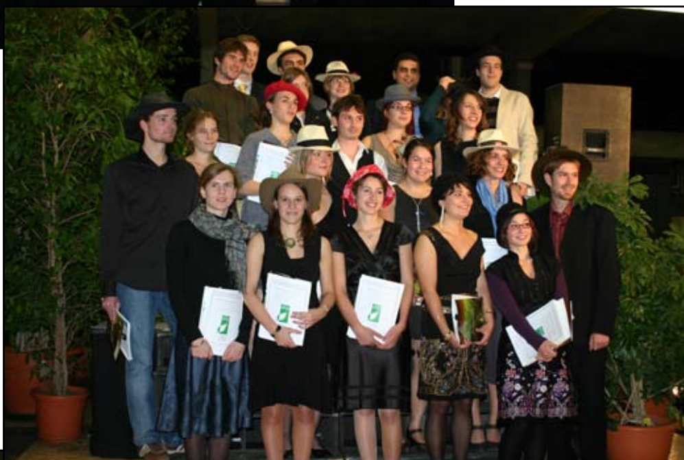
Les diplômés 2008 de l'option paysage IT (Ingénierie des Territoires)