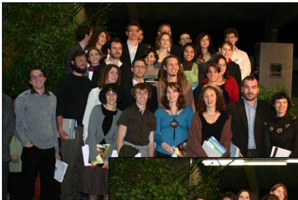
Les diplômés 2008 de l'option paysage MOI (Maîtrise d'oeuvre et Ingénierie)