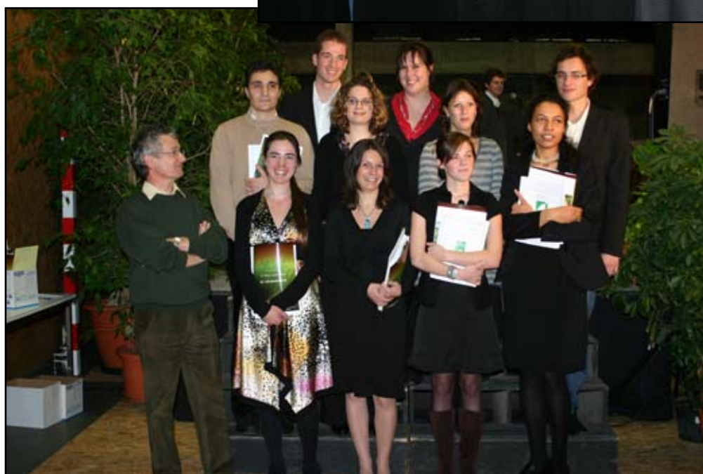
Les diplômés 2008 de l'option SEVE (Santé du Végétal et Environnement)