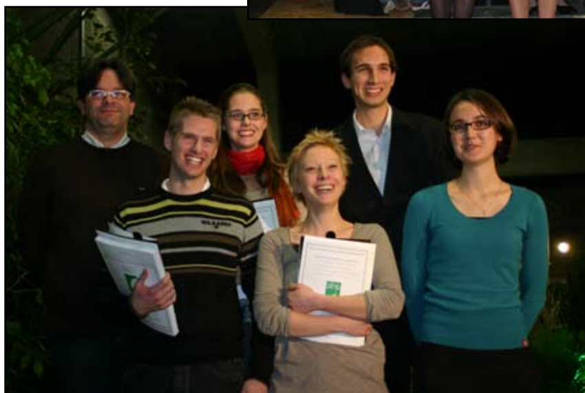
Les diplômés 2008 de l'option APS (Amélioration des plantes et semences)