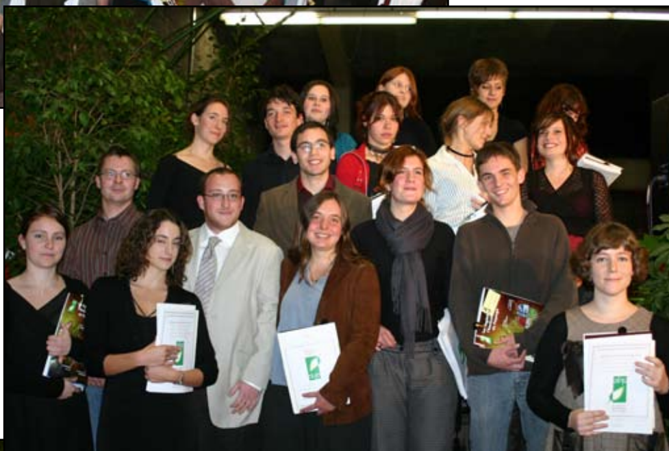
Les diplômés 2008 ayant suivi une option dans un autre établissement