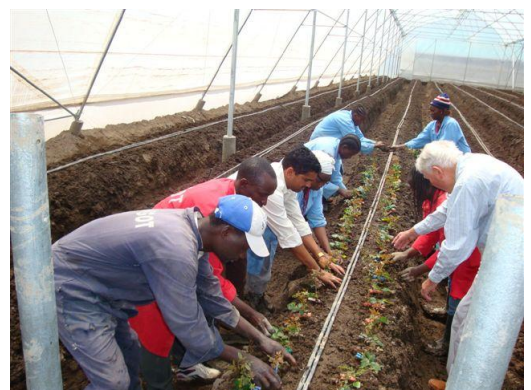
La production sous tunnel au Kenya

Bref Bigot-Flours essaie de jouer au mieux son rôle d'oasis de technologie française et de know-how au Kenya. A ce titre, nous venons d'être reconnus dignes d'une participation du Fonds d'Investissement et de Soutien aux entreprises en Afrique sous les auspices de l'Agence Française de Développement.