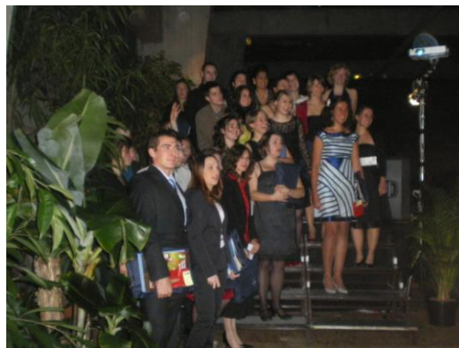
Promotion IT 2010

Les étudiants diplômés ont reçu lors de cette cérémonie en plus de leur diplôme, un stylo en bois de la part de l'AIHP à l'effigie de la promotion 2010.