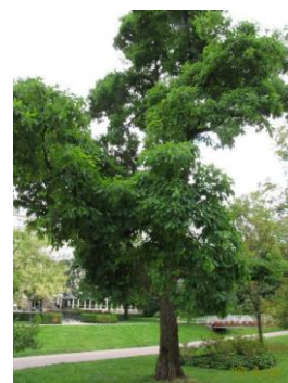
Laurier des Iroquois